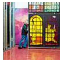
Arts / Artisanat Culture