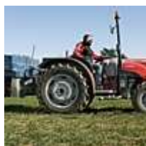
Agriculture / Bois