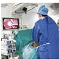
Santé / Social / Sport