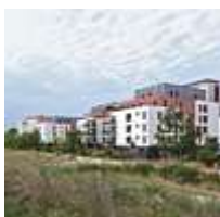
Architecture Travaux publics