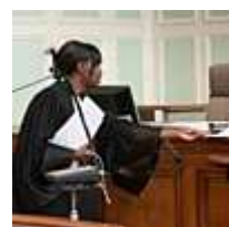
Droit Économie Gestion