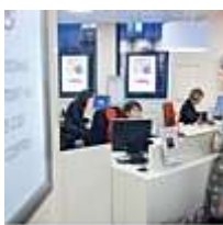
Banque Assurance Immobilier