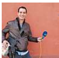
Audiovisuel Information Communication