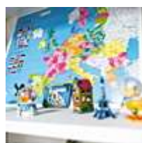
Hôtellerie Restauration Tourisme