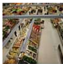
Commerce Vente Marketing