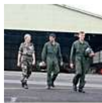
Armée / Sécurité